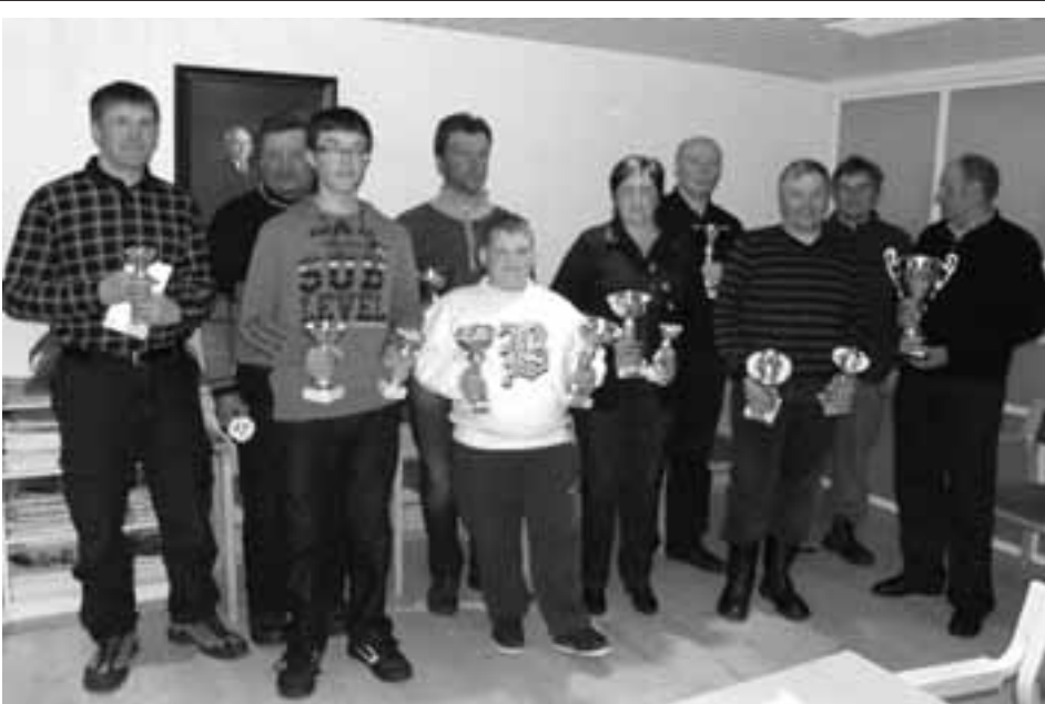
Leukin vuosikokouksessa palkittuja menestyjiä.

Puh. (06) 5126 361 Fax (06) 5126 362 040 5126 361 email. t.i@garnjet.inet.fi